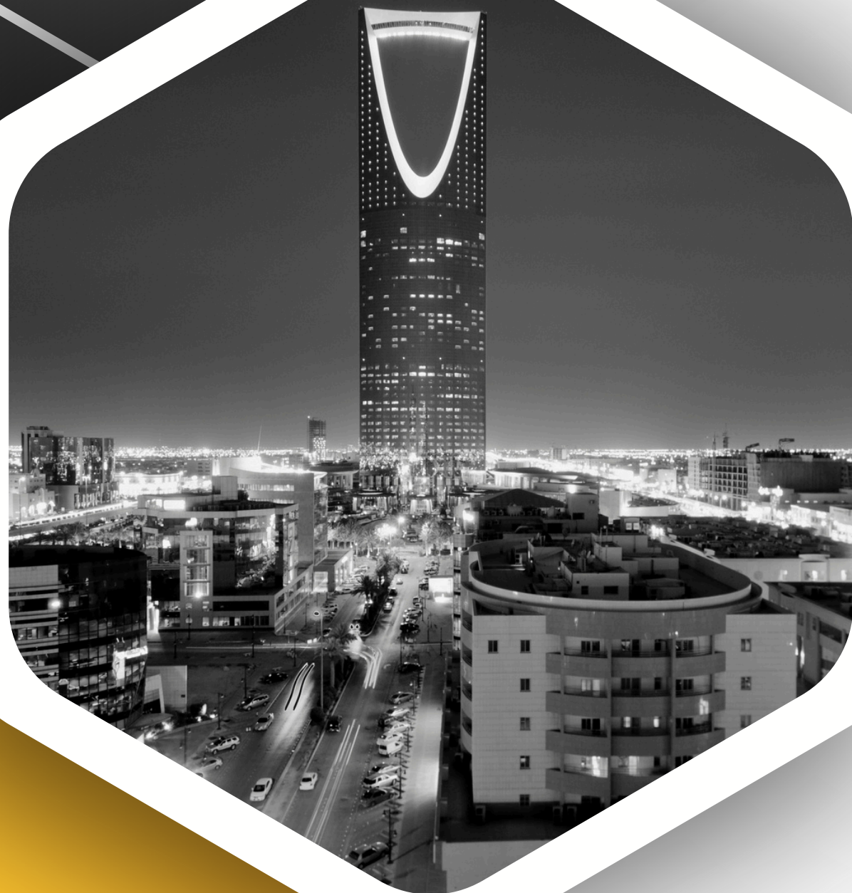
TABLE OF CONTENT